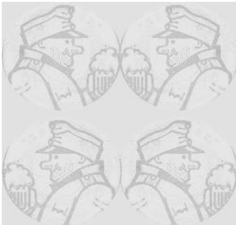
Obr. 2: Popis obrázku (jeho reálna veľkosť)

je jeden z najslávnejších fiktívnych detektívov na svete. Mal brata Mycrofta. Býval na Baker Street 221b v Londýne. Holmes mal všestranné záujmy, napr. hru na husle, chemické pokusy, strelbu z revolvera a box. Podľa Watsona bol 180 cm vysoký, chudý, mal prenikavé oči a tenký orlí nos. Známy je tiež svojou fajkou a cestovnou čiapkou s dvomi šiltmi. Jeho úhlavný nepriateľ bol profesor Moriarty. Ten sa objavil v príbehoch Posledný problém (1893) a Údolie hrôzy (1915).