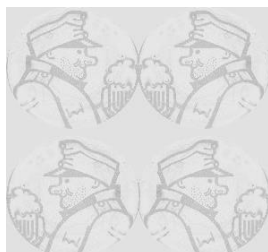
Obr. 3: Popis obrázku (jeho šířka 3.5cm)