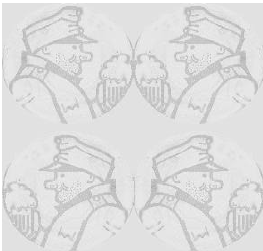
Obr. 4: Popis obrázku (jeho šířka 12cm)